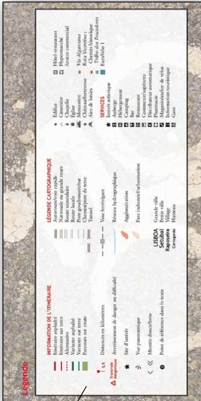
Une légende iconographique

Neuf pages de cartes et commentaires généraux