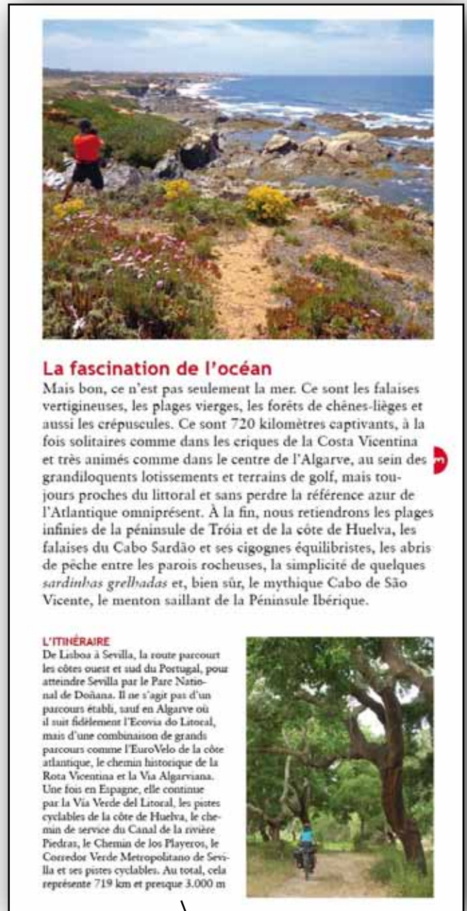
Information générale thématique destinée aux cyclistes