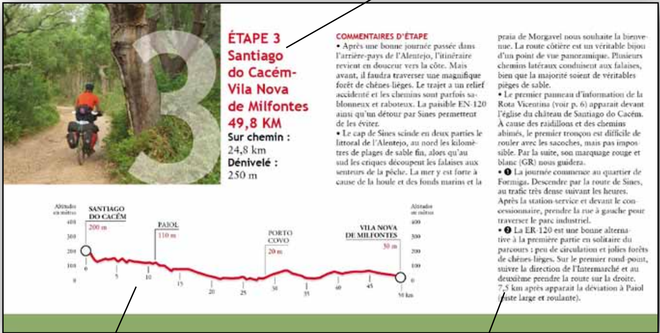
Profil topographique de l'étape